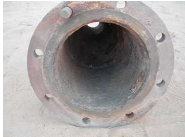
Repérage d'une tuyauterie radioactive sur le marché à Arlit (Mesures CRIIRAD de décembre 2003).

Les contrôles effectués en avril 2007 par deux étudiantes 6 permettent de confirmer que des ferrailles contaminées et irradiantes sont en fait toujours présentes par exemple chez un ferrailleur 7 ou dans des lieux habités. Les compagnies minières n'ont soit pas mis en œuvre soit de façon inefficace la recommandation formulée par la CRIIRAD en 2003 : le lancement d'une grande campagne d'information et de détection radiométrique permettant de repérer, de racheter et d'isoler les ferrailles contaminées détenues par des particuliers.