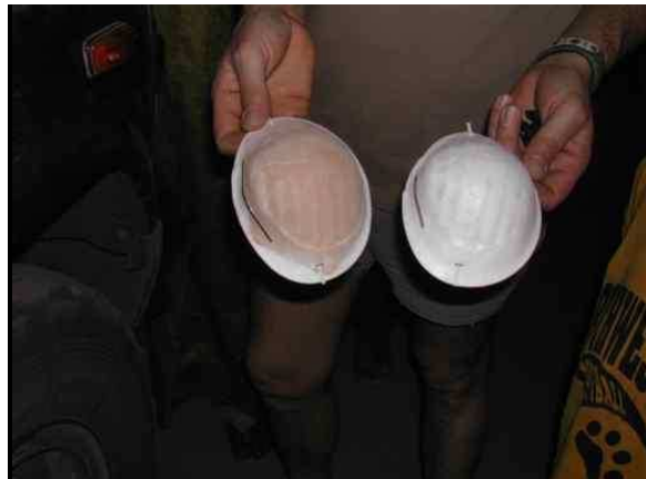
Mise en évidence du fort taux d'empoussièrément dans les rues d'ARLIT (CRIIRAD, déc. 2003).