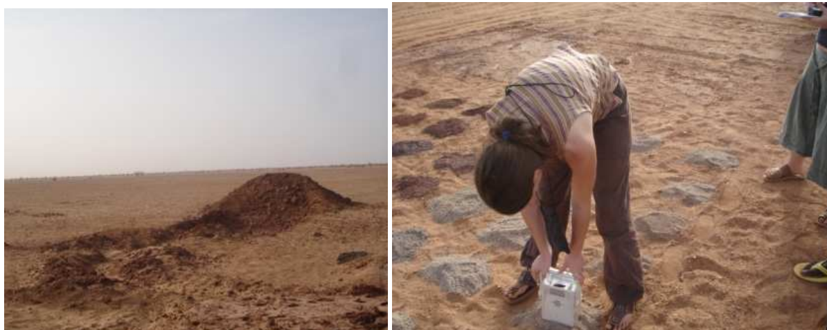
Imouraren forage 1 / forage 3

Les mesures effectuées par deux étudiantes 11 en avril 2007 dans la zone de forage d'Imouraren ont révélé des niveaux de radiation gamma 5 à 9 fois supérieurs à la normale au contact des tas de boue séchée laissés en place au droit des trous de forage (cf. photographies ci-dessous). Ces petits monticules de terre sont observables « à perte de vue » et sans aucun confinement. Ces opérations de forage conduisent donc bien à ramener des matériaux radioactifs à la surface.