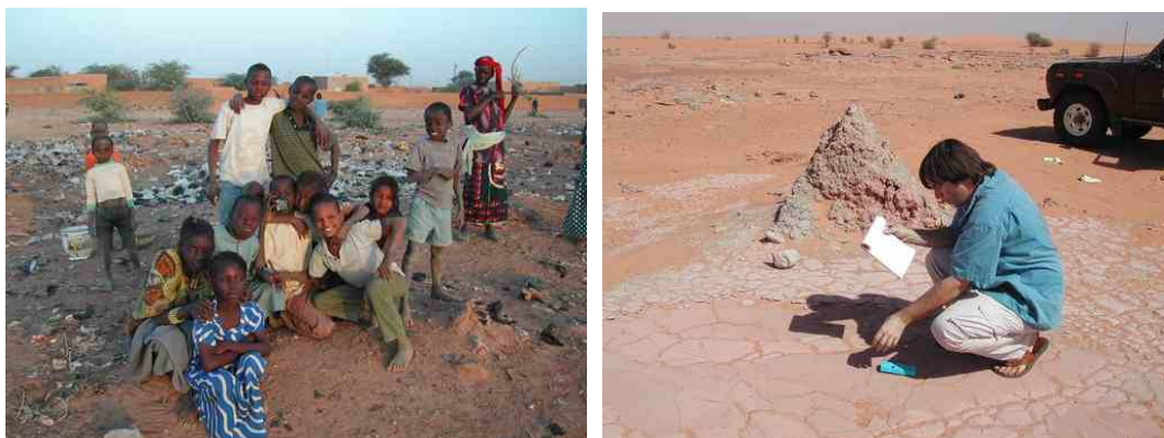
Faubourg d' ARLIT / Mesures radiométriques CRIIRAD sur boues de forage

En association avec d'autres partenaires (le gouvernement du Niger à travers l'ONAREM, le Japon (OURD) et l'Espagne (ENUSA)) la production d'uranium a commencé en 1971 à travers la filiale SOMAÏR, suivie par la COMINAK.