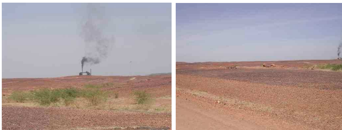
Centrale au charbon de SONICHAR, pollution atmosphérique et dépôts noirâtres au sol (CRIIRAD, déc. 2003).

Dans le cadre de sa mission de décembre 2003, la CRIIRAD a pu constater visuellement la pollution des sols (dépôts noirâtres) liée aux rejets atmosphériques de cette centrale thermique (cf. photographie ci-dessous). A Tchirozérine, la population locale se plaint d'ailleurs d'un impact sanitaire lié aux conditions d'exploitation de la mine de charbon et de la centrale thermique.