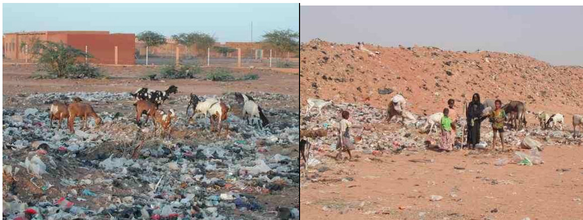
Conditions de « stockage » des ordures ménagères en périphérie d'Arli et Akokan

De plus, les eaux usées des villes sont utilisées pour irriguer les jardins d'Arli. Le traitement préalable consiste en un simple lagunage via 5 ou 6 bassins de décantation.