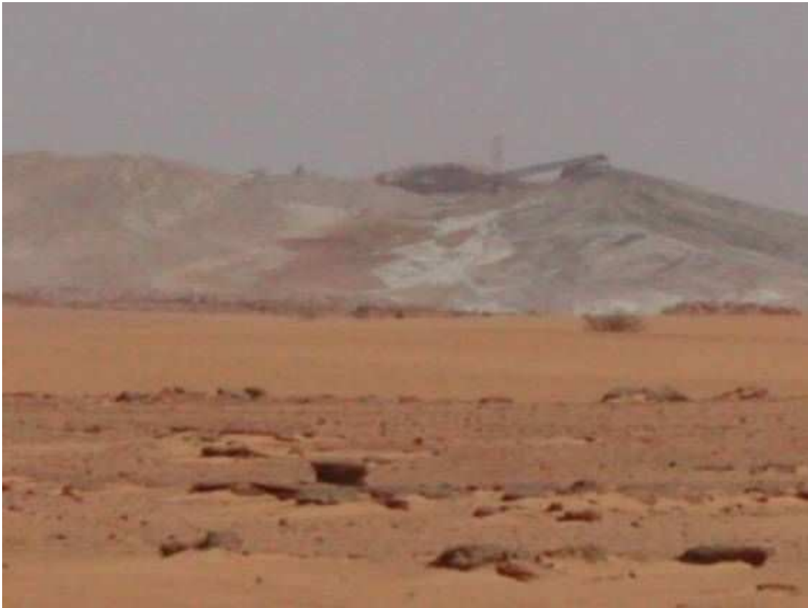
Résidus radioactifs de COMINAK.

Il conviendrait de tenir compte également des autres types de déchets radioactifs solides (par exemple pour SOMAÏR des tas de résidus de lixiviation statique estimés à 12,1 millions de tonnes de minerai à faible teneur en uranium).