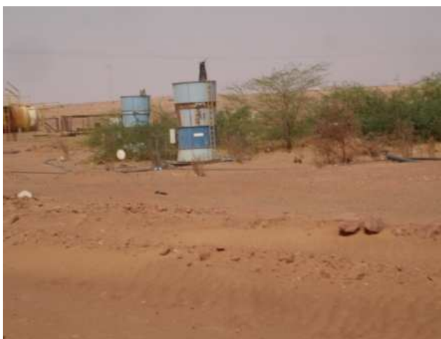
Bouches d'aérage COMINAK