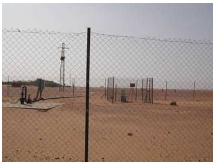
Puits 2002 (ARLIT) / CRIIRAD, décembre 2003

Pourtant le communiqué de presse COGEMA-AREVA du 23 décembre 2003 mentionnait l'« absence de contamination (des eaux) » et le dossier de presse AREVA au NIGER de février 2005 téléchargeable sur le site Areva précisait encore page 10 au paragraphe sur l'eau : « Les analyses bactériologiques (mensuelles), radiologiques (semestrielles) et chimiques (annuelles) montrent l'absence de contamination ».