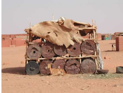
Récupération de ferrailles pour l'habitat, maison d'un ancien travailleur des filiales d'AREVA

Les investigations conduites par la CRIIRAD, en décembre 2003, à l'aide d'un petit radiamètre, dans le cadre de la formation dispensée aux membres d'AGHIR IN MAN ont permis de mettre le doigt sur un problème très sérieux : la dispersion des ferrailles contaminées . Compte tenu du niveau de vie très bas de la population nigérienne, tout est susceptible d'être récupéré et utilisé pour la construction des maisons, de l'outillage, des ustensiles de cuisine, etc.