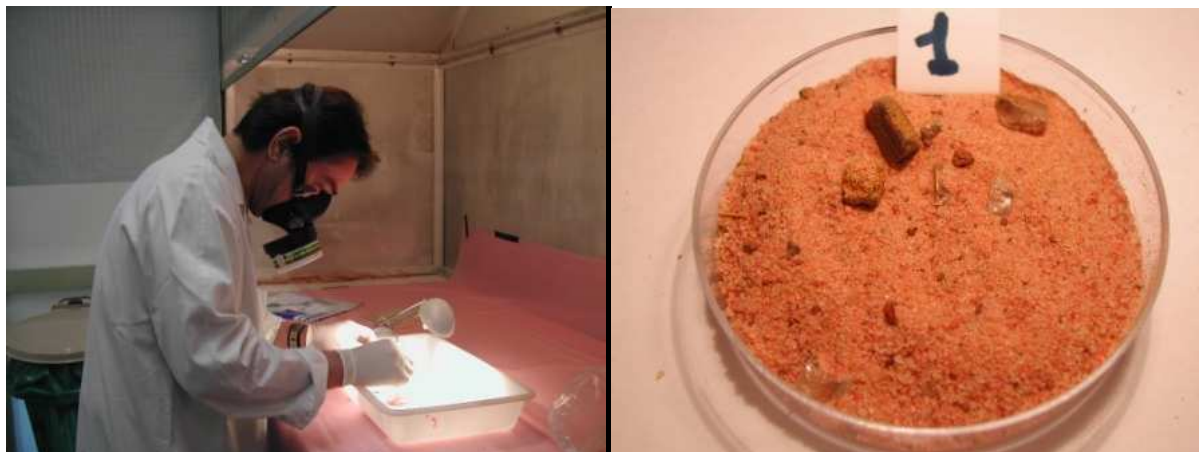
Préparation au laboratoire CRIIRAD des sols contaminés suite à l'accident de transport d'uranate de 2004

En janvier 2004 un accident de transport a fait 5 morts. De la matière radioactive s'est répandue sur la chaussée et malgré les injonctions du Centre National de Radioprotection de Niamey, l'exploitant a mis plus d'un mois pour finir la décontamination, laissant ainsi dans l'environnement des sols dont la contamination en uranium était 1 000 à 10 000 fois supérieure à la normale selon les mesures effectuées par le laboratoire de la CRIIRAD.