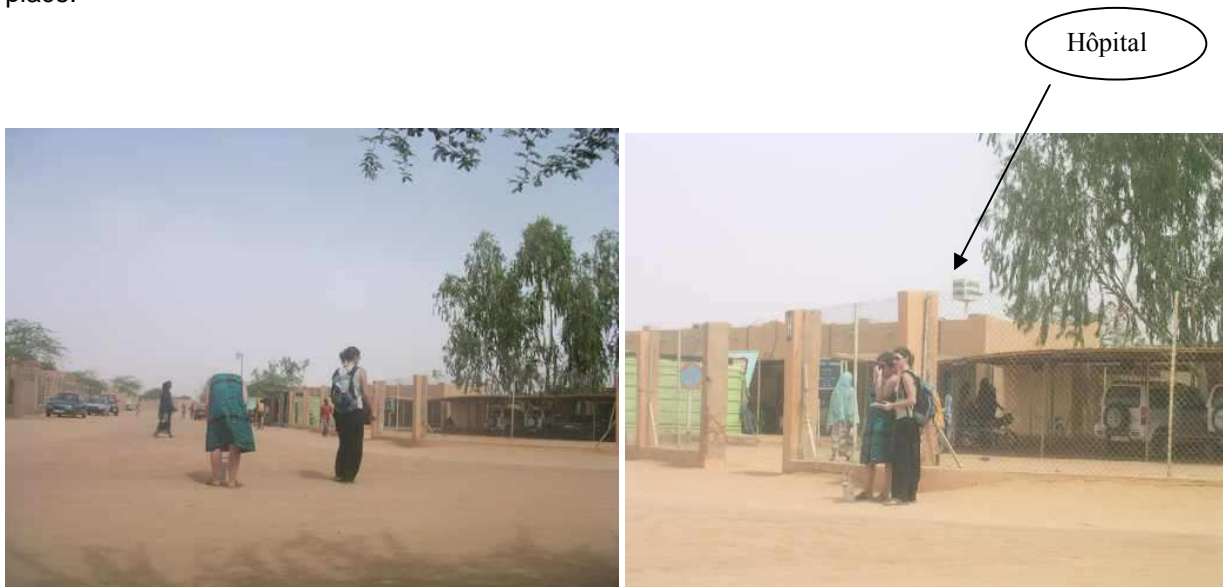
Détection de niveaux de radiation anormalement élevés en avril 2007 devant l'hôpital d'AKOKAN.

A ce jour aucune réponse n'a été apportée à la CRIIRAD et les matériaux radioactifs sont toujours en place.